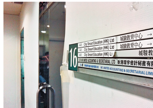
一間疑似冒牌會計公司粵海商務秘書（已改名香港環宇會計秘書），職員向記者表示可提供核數服務，收費由數千元起。